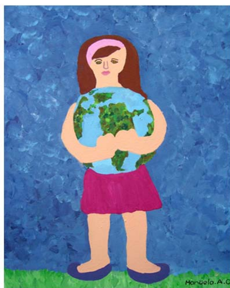
Figura 11- O verbo Ecologizar definido por crianças

ECOLOGIZAR: Darle un gran abrazo al planeta.